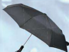
4840.15 schwarz stripe